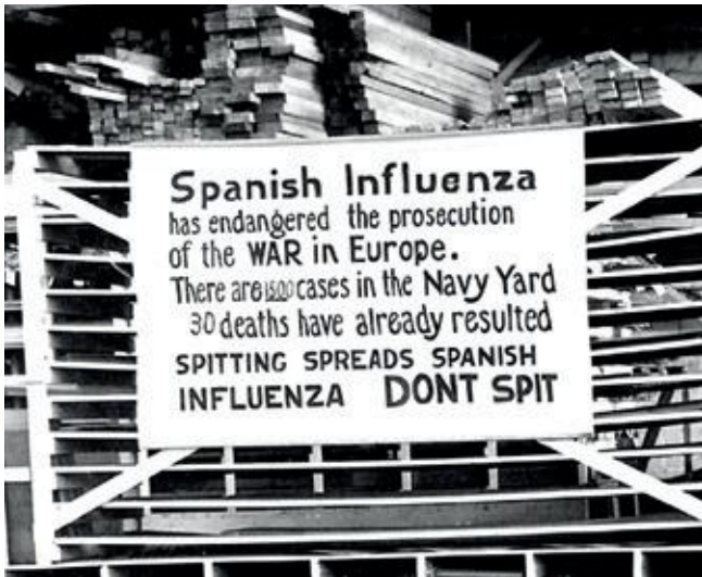
Waarschuwing voor Spaanse griep.

Alle mogelijke drankjes verschenen op de markt en het drinken van alcohol zou ook een patent middel tegen de griep zijn. In de beroemde roman Frank van Wezels roemruchte jaren (1928) van A.M. de Jong werd op ironische wijze het soldatenleven beschreven, inclusief het innemen van veel jenever en bier als probaat middel tegen de griep. Najaar 1918 leek de epidemie af te nemen, maar in november barstte deze in volle hevigheid los. In het hele land heerste hongersnood en toen Troelstra de revolutie uitriep, leidde dit tot een tegen demonstratie in Den Haag met 40.000 Oranjeklanten. Het virus kon zich opnieuw, maar nu razend-snel verspreiden. Ondanks een nationale biddag tegen de ziekte kostte de Spaanse griep uiteindelijk 30.000 Nederlanders het leven.