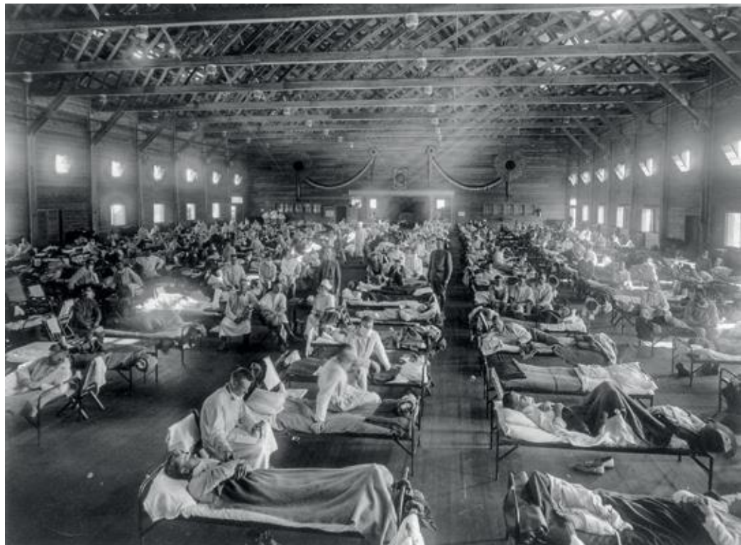
Militair hospitaal tijdens de Spaanse griep in Funston, Kansas.