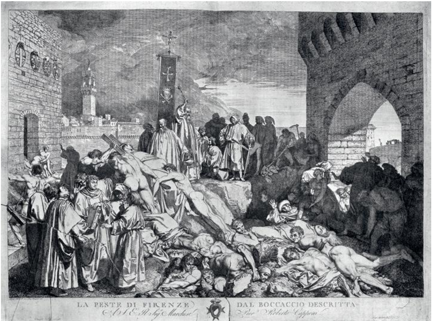
Pest in de Middeleeuwen naar Boccaccio's Decamerone.