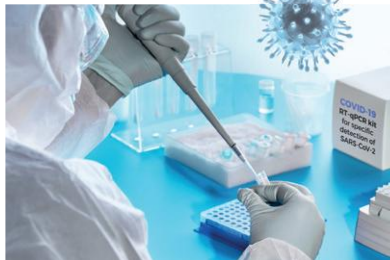
Coronatetest in laboratorium.

Tot slot: laten wij ons houden aan de op wetenschappelijk onderzoek gebaseerde adviezen van de overheid en ons niet gek laten maken. Zorg voor elkaar en blijf gezond.