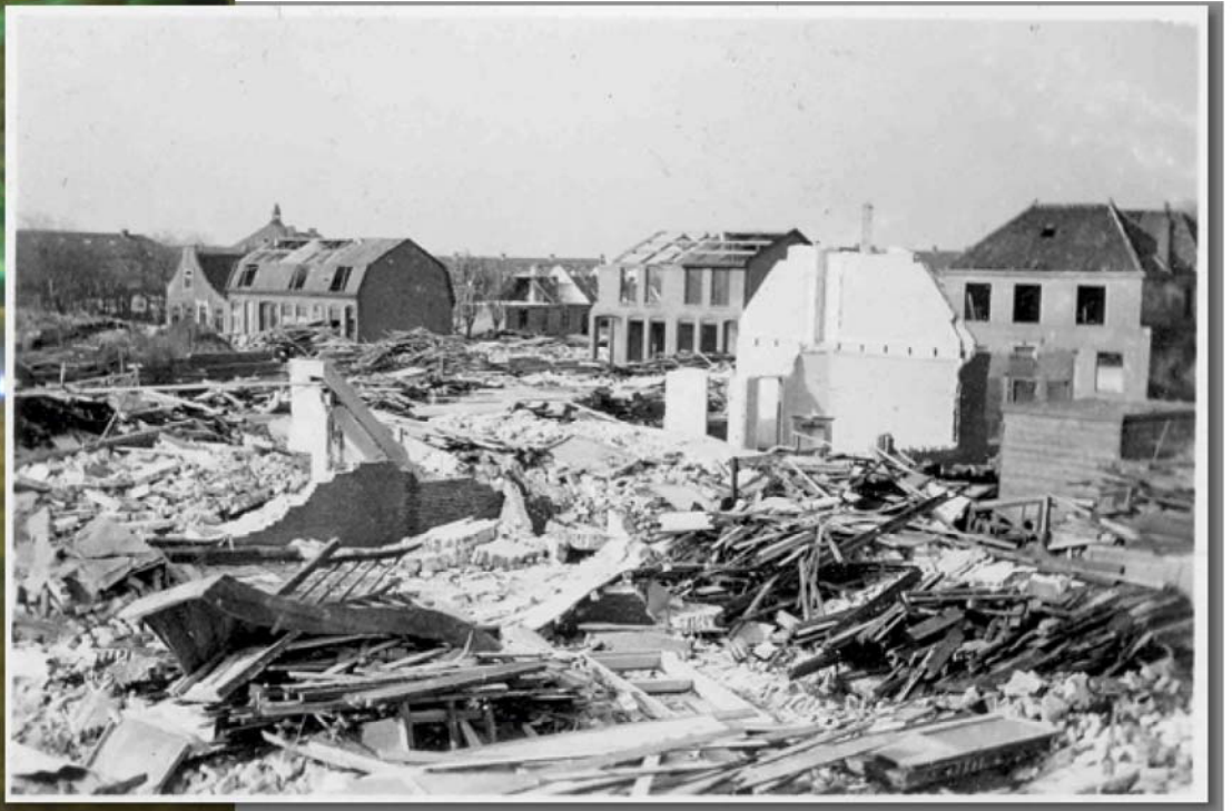
Geen stad in Nederland werd zo zwaar gebombardeerd als Den Helder.