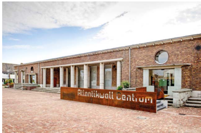
Entree van het Atlantikwall Centrum.

Niet ver daarvandaan bevindt zich Fort Kijkduin. Een groot militair bouwwerk dat een bonte verzameling activiteiten herbergt. Aangezien het fort uit de voor-napoleontische tijd stamt, wordt hier aandacht besteed aan de zeeslag bij Kijkduin in 1673.